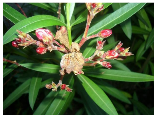
Grauschimmelpilz an Oleanderblüte

Regelmäßig und wiederholt müssen die Pflanzen kontrolliert werden und es müssen kurzfristig Maßnahmen eingeplant werden wie ausputzen schnitt, lüften etc..