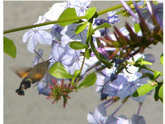
Taubenschwänzchen (links) an blühender Kübelpflanze im Herbst

Nicht nur die Verwendung des Gemüses macht die Ernte im Garten vielfältiger, sondern unterstützt im Spätsommer, wenn andere Blüten für die Ernährung von Insekten bereits rar sind, die Versorgung dieser Tiergruppen. Unterstützt wird dies noch durch einen späten Blattlausbefall, der räuberische Insekten zusätzlich anlockt.