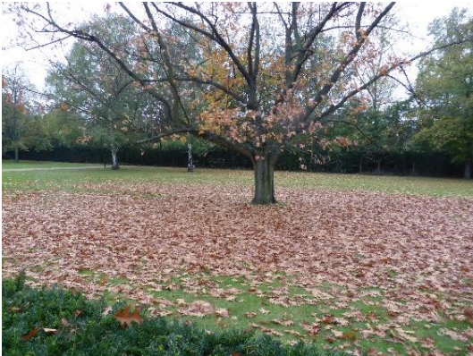
Laubfall im Herbst

zu machen, dass das Verbleiben oder Entfernen von Laub aus dem Garten spezifisch betrachtet werden muss.