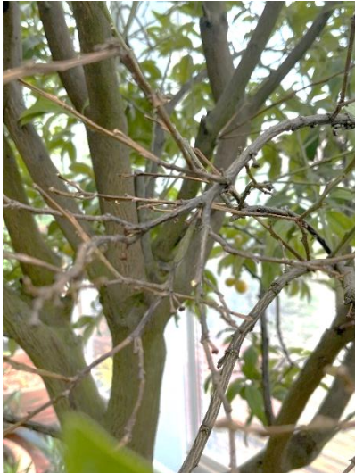
Abgestorbene Äste am Zitrus nach Pilzinfektion

Jetzt ist die Zeit, dass die Kübelpflanzen, die überwintert werden sollen, gezielt darauf vorzubereiten sind.