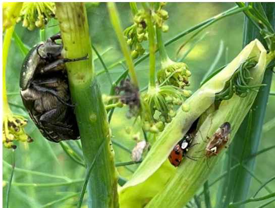
Rosenkäfer, Marienkäfer, Wanzen an blühendem Knollenfenchel im Herbst

Knollenfenchel, Artischocken, Auberginen, Paprika- und Chilisor-ten finden immer mehr Platz in den Gärten, weil sie aufgrund der Temperaturerhöhung und der damit einhergehenden Saisonverlängerung auch im Freiland ertragsbildend wachsen.