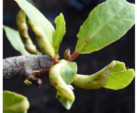
Deformierte chlorotische Blätter nach Befall durch den Lorbeerblattfloh

An einigen Orten konnte der Lorbeerblattfloh festgestellt werden, bei geringem Befall reicht vor der Überwinterung ein Ausschneiden der Befallsstellen aus.