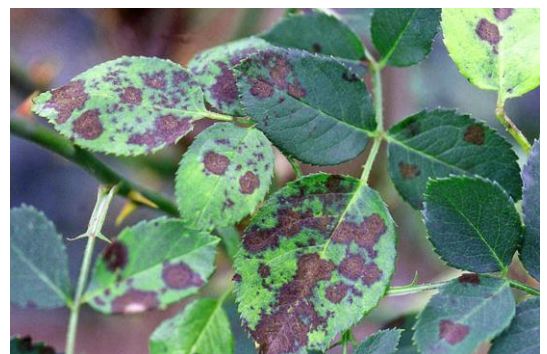
Sternrußtau an Rosen überdauert am Blatt für eine Neuinfektion im kommenden Jahr