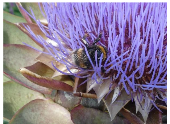
Hummeln jetzt noch an blühenden Artischocken

Jetzt lassen sich unterschiedliche Käfer-, Wanzen-, Schmetterlings- und auch Schwebfliegenarten und auch Wildbienenarten beobachten.