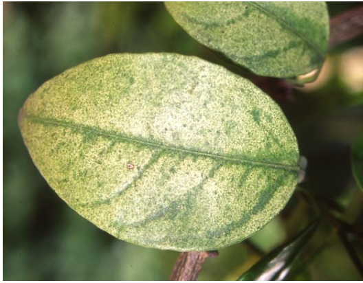
Zitrusblatt geschädigt durch Spinnmilben

Unter den tierischen Schädlingen spielen in diesem Jahr besonders Spinnmilben eine Rolle. Oleander, Zitruspflanzen, Frangipani u.a. sollten kontrolliert werden. Bei starkem Befall ist eine Behandlung mit einem akariziden Wirkstoff sinnvoll, um einer weiteren Ausbreitung entgegen zu wirken.