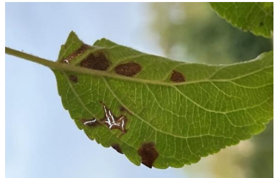
Apfelblatt mit Schorfinfektion im Herbst

Heute möchten wir Ihnen die Beispiele zur Überwinterung von Schadorganismen am/im Laub vorstellen, um klar